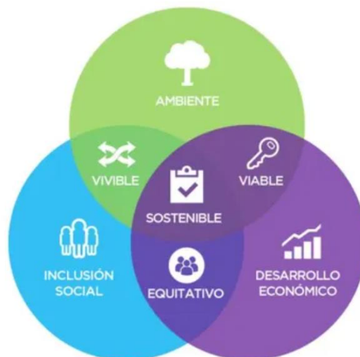
Ilustración 9: Interrelación entre los aspectos que abarcan las empresas B.