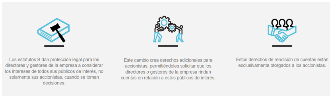
Ilustración 2: Beneficios de un cambio en el Estatuto.

Más allá de la validación que tiene que hacer la empresa de sus prácticas, procesos y políticas, B Lab exige un cambio en el estatuto o un cambio de tipo societario.