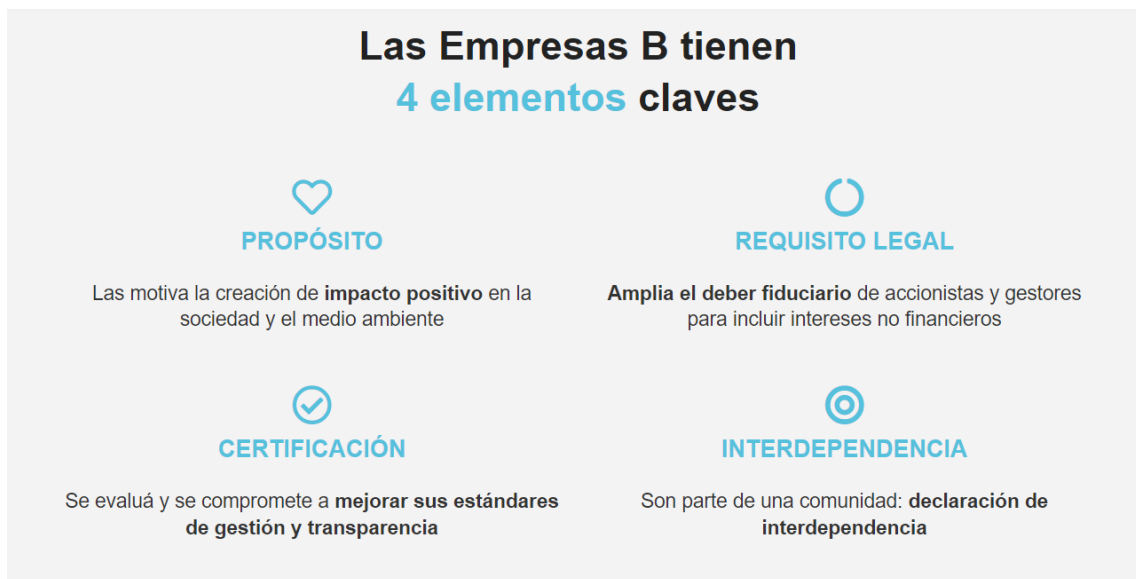
Ilustración 1: Elementos claves de las empresas B.

Se exponen 4 elementos claves para las Empresas B: